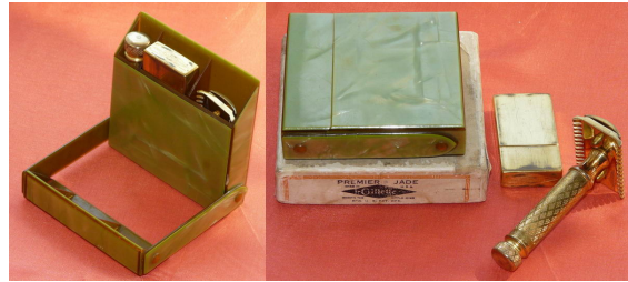
Afbeelding 2: De 'Milady Décolletée' uit 1921, een luxeversie uitgevoerd in jade.