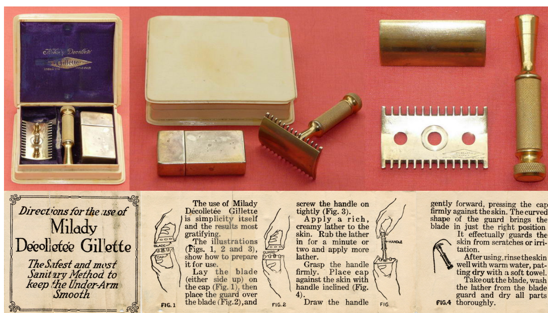
Afbeelding 1. De "Milady Décolletée" van Gillette (1915) met gebruiksaanwijzing (1918) 4