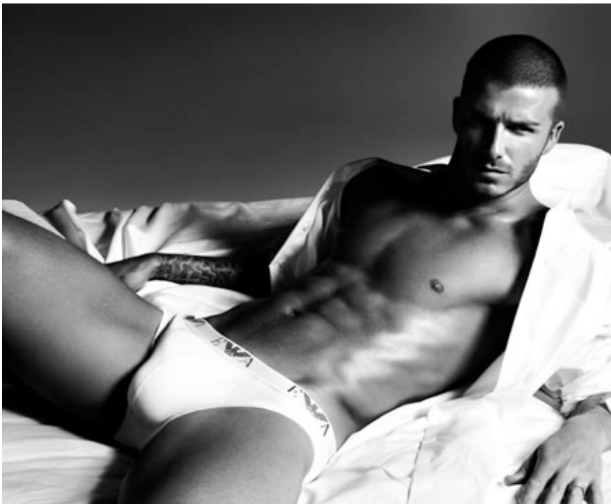
Afbeelding 2: Het prototype 'metroseksueel' en hedendaags sekssymbool: David Beckham in de reclamecampagne uit 2007 voor de onderbroekenlijn van Emporio Armani. 16