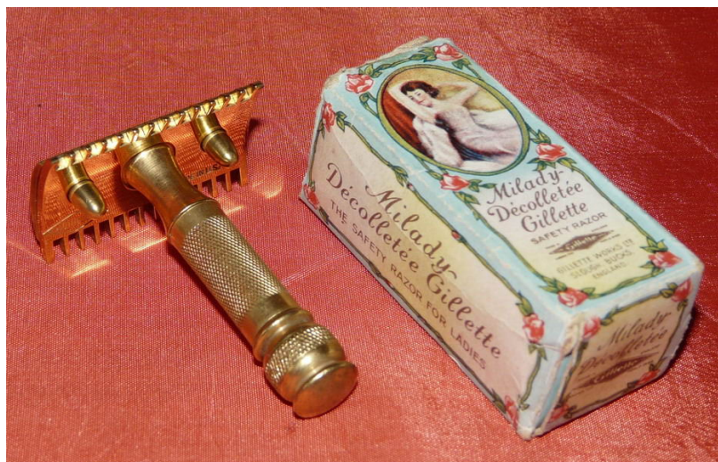
Afbeelding 3: De "Milady Décolletée" van Gillette uit de jaren '20, inclusief verpakking.

In dit tweede offensief tegen het beenhaar worden de redacteurs van diverse vrouwenbladen ingeschakeld. Daarnaast wordt het ontharen als gewoonte opgenomen in de schoonheidshandboeken voor vrouwen. De benen komen meer en meer centraal te staan. Gebruinde en gladde benen worden een op zichzelf staand modeartikel. De advertenties voor ontharingsmiddelen veranderen van toon. Ze zijn erop gericht zoveel mogelijk vrouwen over te halen tot het volgen van deze nieuwe mode. Hiervoor worden zowel argumenten als informatieve tekstjes ingezet. De nieuwe mode van doorschijnende kousen keert bovendien terug als argument voor gladde, haarloze benen.