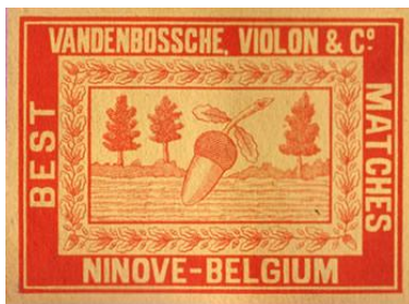
Luciferdoosje zoals ze gemaakt werden in Ninove

In 1940, aan de vooravond van de Tweede Wereldoorlog, telde Ninove 5.490 mannelijke en 5.744 vrouwelijke inwoners. 156 De stad ging de oorlog in als een ware industriestad. De aansluiting op het spoorwegennet in 1857 en de kanalisatie van de Dender tien jaar later hadden immers de industrialisatie van de stad op gang gebracht. 157 Tegen 1937 waren er dan ook 111 nijverheidsinrichtingen met personeel gevestigd. 158 Vooral de textiel- en luciferindustrie floreerden in de stad aan de Dender. Zo besloegen de terreinen van de textiel fabrieken Sofilaine, Fabelta, Etablissement Stichelmans & Fils en Werkhuizen Schuermans al gauw verschillende hectaren. Dit maakte van Ninove het op één na belangrijkste centrum van de textielindustrie in het arrondissement. Bovendien was het ook het belangrijkste centrum van de luciferindustrie in het arrondissement Aalst. 159